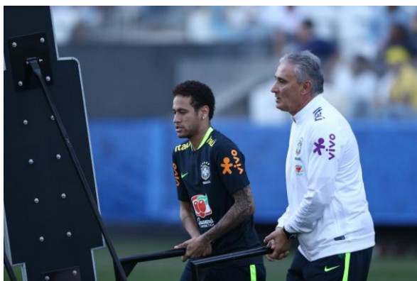
Tite confia em sucesso de Neymar no PSG

- É uma situação muito particular, própria, individual. O que é motivação para um, pode não ser para outro. Eu quero que seja feliz ele, a família dele, as pessoas próximas. Ele estando feliz, vai executar a sua atividade profissional bem. São clubes de alto nível, tanto PSG, quanto Barcelona - resumiu.